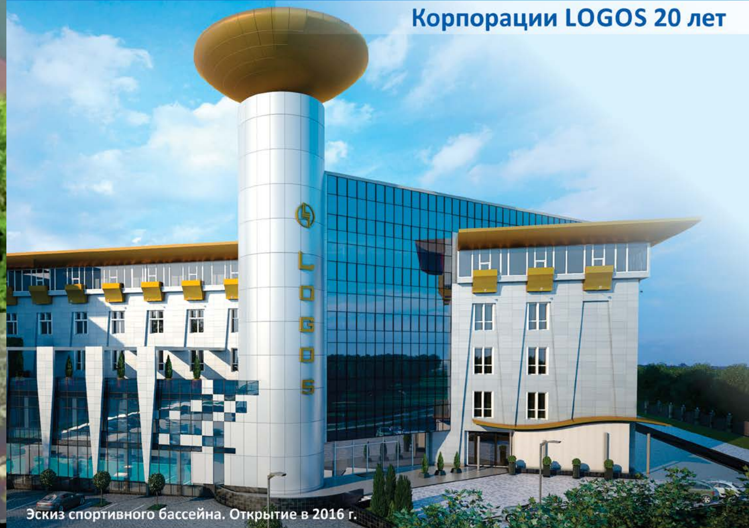
Эскиз спортивного бассейна. Открытие в 2016 г.

Лучшее место для вашего отдыха и бизнеса!